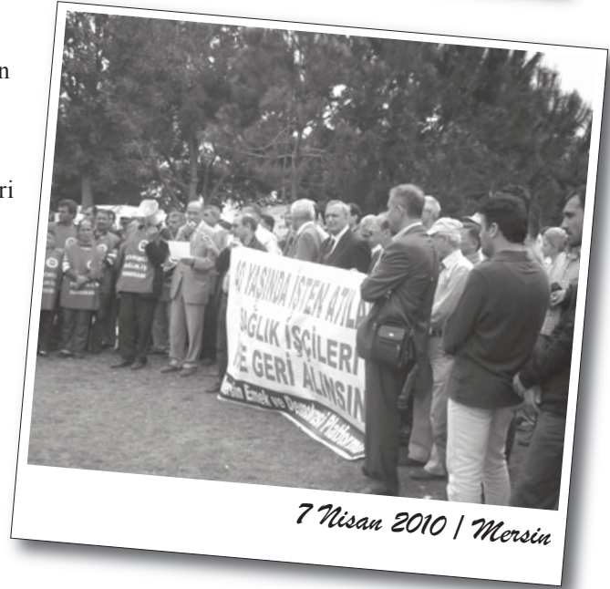
7 Nisan 2010 | Mersin

de katılımıyla devam etti. 55 işçinin katılımıyla beraber 75 işçi, 4 Nisan sabah saatlerinde İZAYDAŞ önünde oturma eylemi başlattı.