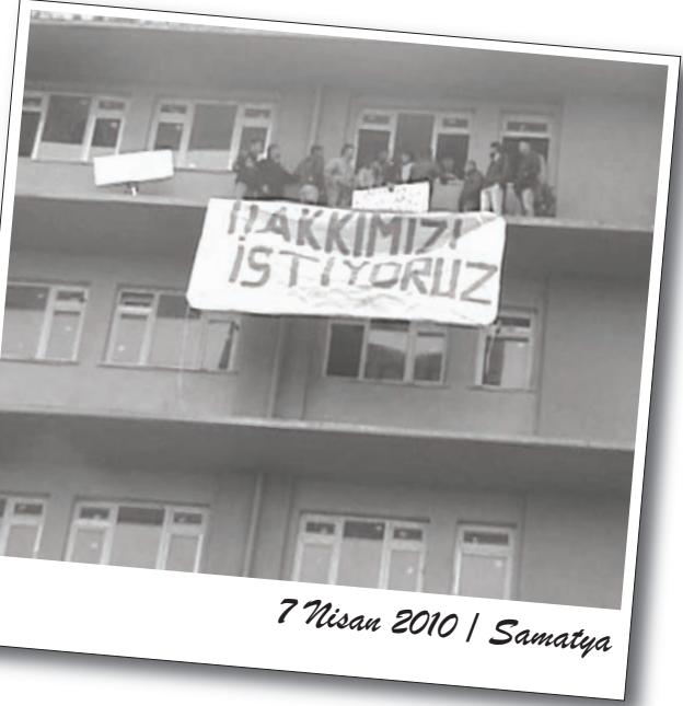
7 Nisan 2010 | Samatya

20 işçinin gerçekleştirdiği eylem, yeni işçilerin